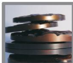
presse - papiers